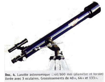
Doc. 4. Lunette astronomique \varnothing 60/800 mm (diamètre et focale) livrée avec 3 oculaires. Grossissements de 40 \times , 64 \times et 133 \times .