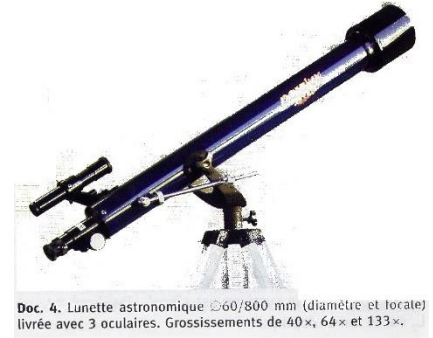
Doc. 4. Lunette astronomique Ø60/800 mm (diamètre et focale) livrée avec 3 oculaires. Grossissements de 40×, 64× et 133×.